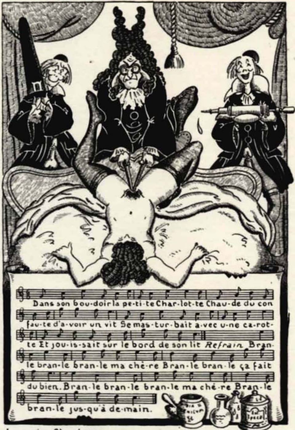
La petite Charlotte